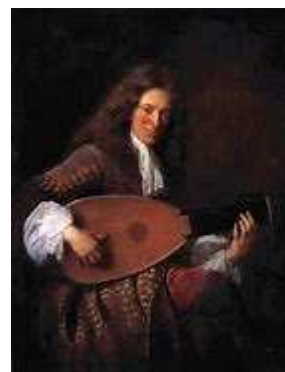
R. de Visée

Un exemple de Chaconne pour piano, 'Page clavier'